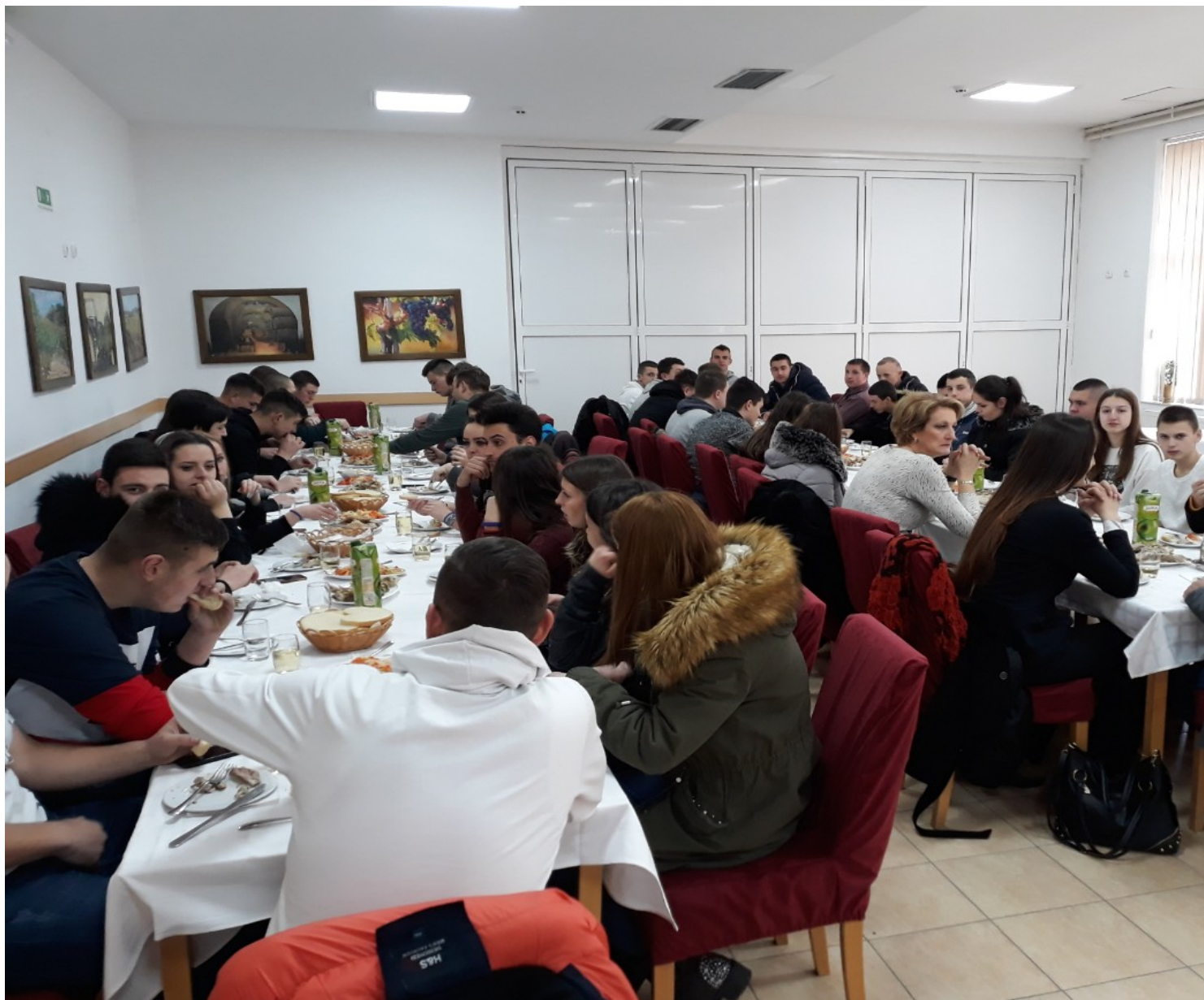
Srednja škola Sveti Trifun i Poljoprivredna škola Priština Lešak potpisali su memorandum o saradnji i unapredjenju obrazovnog procesa nastave.