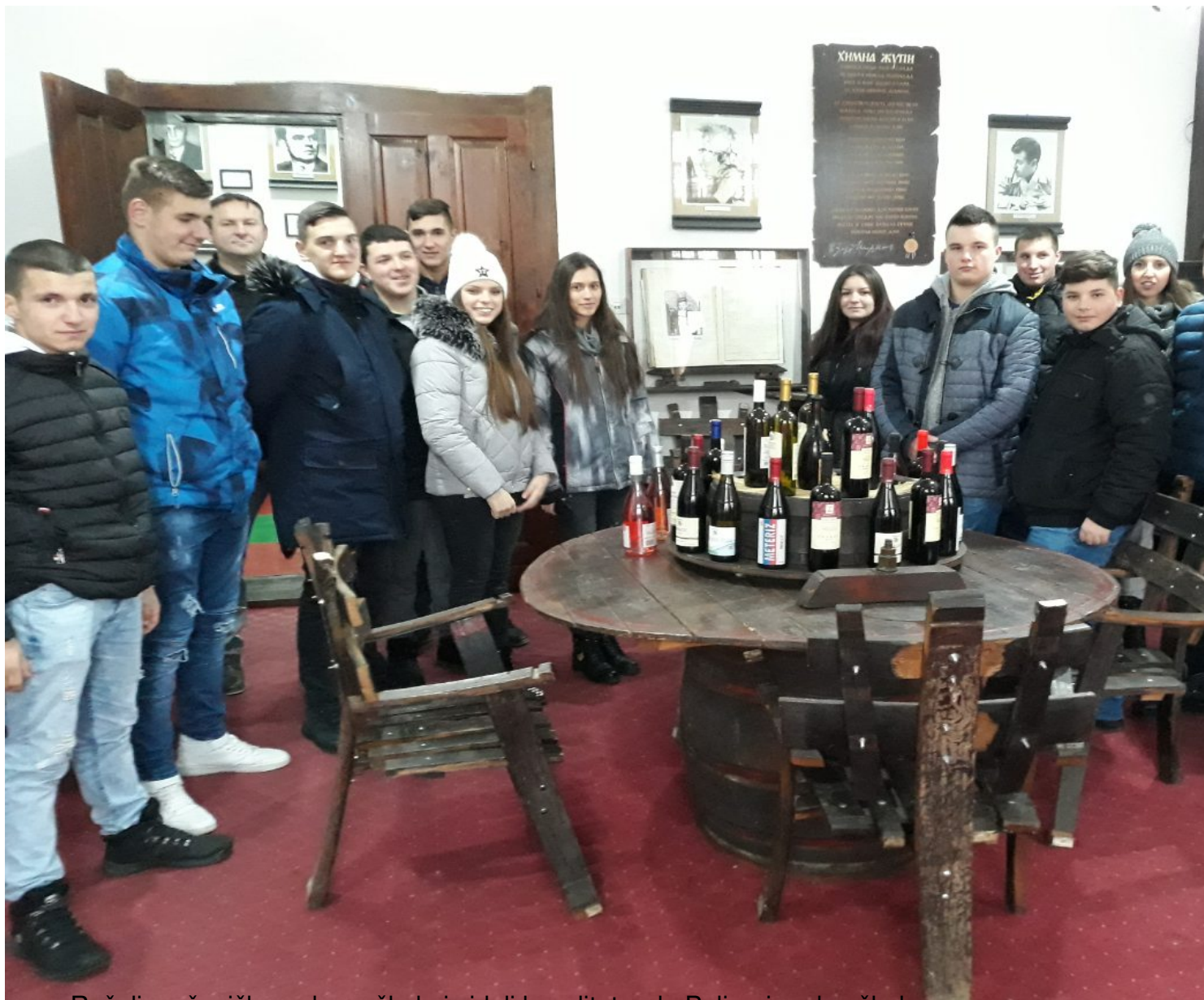
- Ručali u učeničkom domu škole i videli kavalitet rada Poljoprivredne škole

četrvtak, 14 februar 2019 00:00 - Poslednje ažurirano ponedeljak, 25 mart 2019 10:30