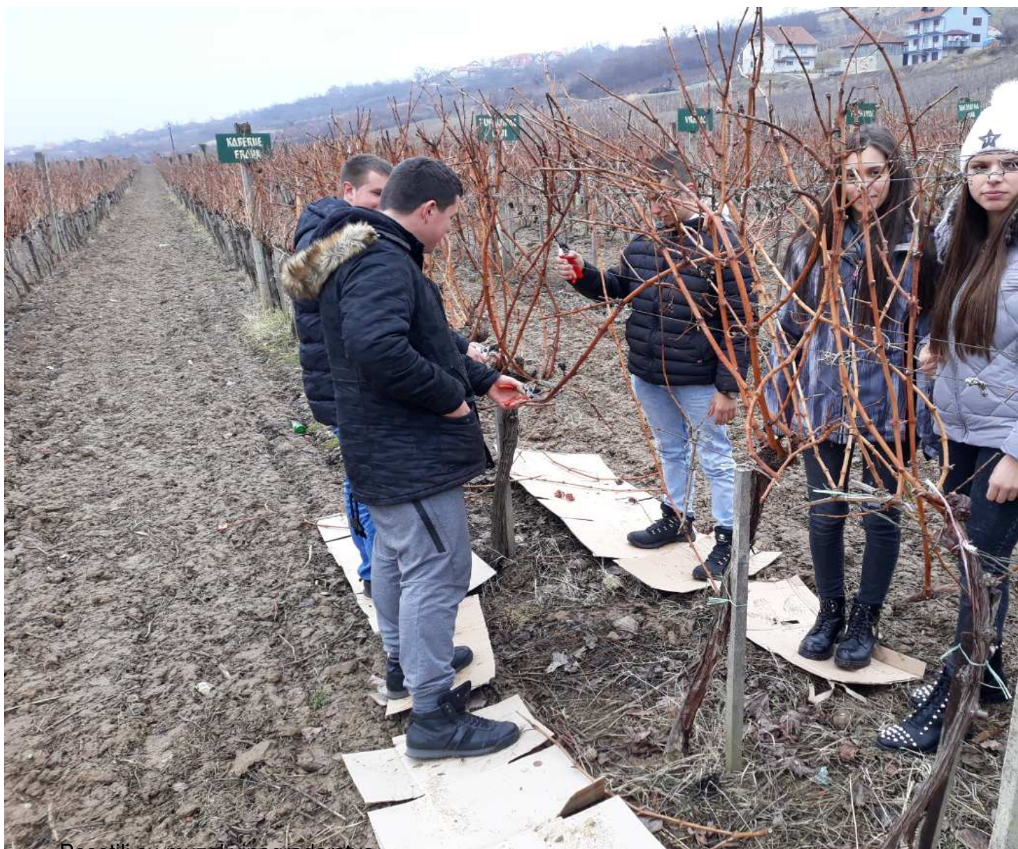
- Posetili su muzej vinogradarstva

četvrtak, 14 februar 2019 00:00 - Poslednje ažurirano ponedeljak, 25 mart 2019 10:30